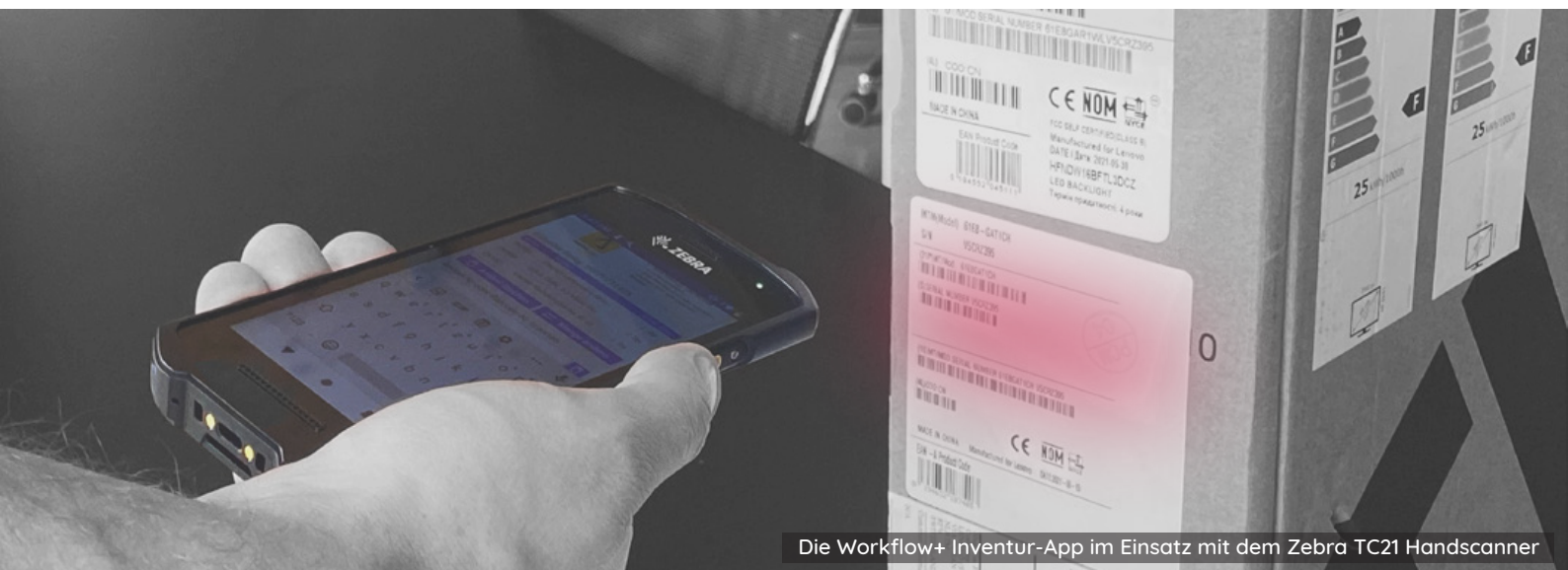
Die Workflow+ Inventur-App im Einsatz mit dem Zebra TC21 Handscanner

Die Inventur-App kann mit nahezu jedem beliebigen Android oder iOS-Gerät betrieben werden.